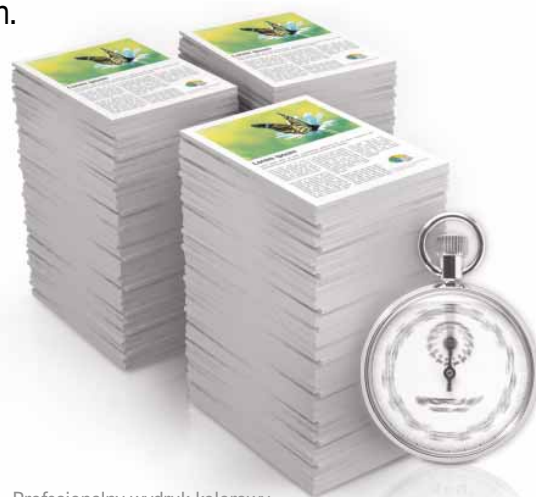
Profesjonalny wydruk kolorowy.

Łatwo, szybko i na miarę – są to słowa kluczowe, opisujące nowy sposób programowania prac. Urządzenie Pro™C900 nie wymaga doświadczonej obsługi, aby wykonywać kompleksowe zadania. Dzięki czytelnemu, opartemu o zakładki sterownikowi EFI, każdy może tworzyć profesjonalnie wyglądające broszury w kilka sekund, a zaawansowane zarządzanie dokumentami oraz impozycja dopełniają miana urządzenia niezwykle łatwego w obsłudze.