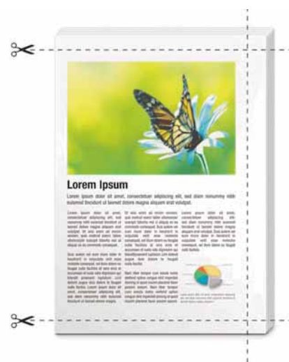
Automatycznego docinanie jednego lub trzech brzegów.